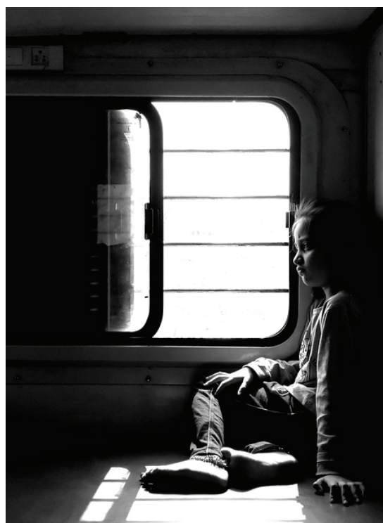
Imagen 1. Shyva. Imagen de Tren, Niño y Triste.

En México, por ejemplo, de acuerdo con el Instituto Nacional de Estadística y Geografía (INEGI), los datos del 2023 reflejan una realidad preocupante: 46 de cada 100 personas de 5 a 29 años con discapacidad asistían a la escuela, en comparación con el 60 de cada 100 de la población sin discapacidad ( Imagen 1 ). 4