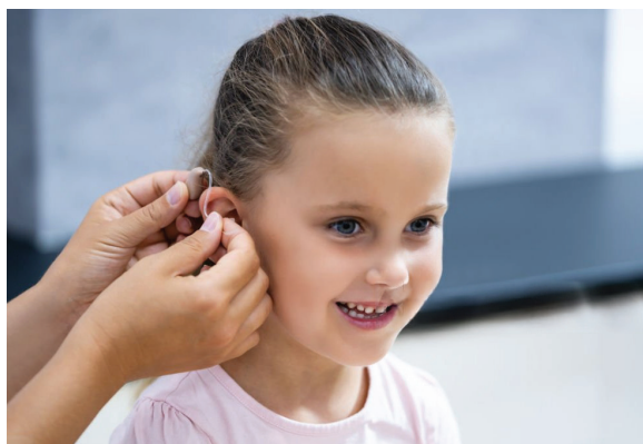
Imagen 2. Popov A. Audífono de audiología para niños.

Sin embargo, nos enfrentamos a situaciones contrarias al deber ser, que se materializan como barreras, en perjuicio de la comunidad sorda ( Imagen 2 ).