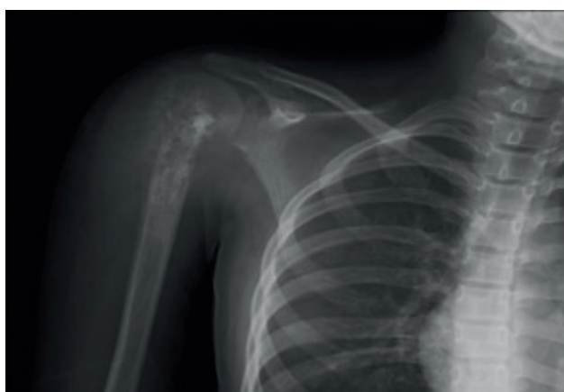
Imagen 1. Radiografía de hombro derecho con presencia de lesión lítica en diáfisis proximal del húmero.

Se trata de un paciente femenino de 12 años que en junio del 2023 presenta limitación del movimiento, parestesias y disminución de la fuerza de la extremidad superior derecha; acompañado de dolor tipo pulsátil y aumento de volumen en el hombro de manera ipsilateral. Por lo que dentro del abordaje inicial del paciente en su unidad de adscripción se decide tomar una radiografía de hombro derecho ( Imagen 1 ), la cual mostraba la presencia de una lesión lítica en región proximal de hombro derecho.