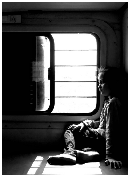
Imagen 1. Shyva. Imagen de Tren, Niño y Triste.

En México, por ejemplo, de acuerdo con el Instituto Nacional de Estadística y Geografía (INEGI), los datos del 2023 reflejan una realidad preocupante: 46 de cada 100 personas de 5 a 29 años con discapacidad asistían a la escuela, en comparación con el 60 de cada 100 de la población sin discapacidad ( Imagen 1 ). 4