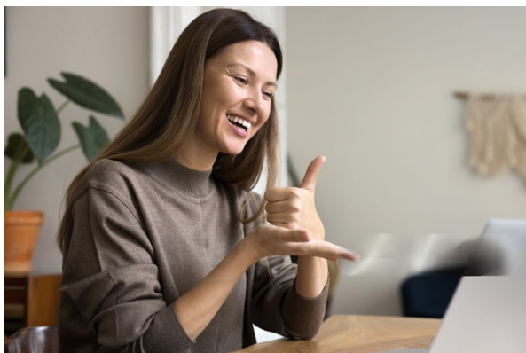
Imagen 4. rnaux. Familia sorda poniéndose al día durante una videollamada en una computadora portátil.

Sordos señantes, aquellos con sordera congénita o desde el nacimiento cuya identidad y comunicación se basan en la cultura sorda; los sordos hablantes, individuos que crecieron con una lengua oral, pero perdieron la audición y los sordos semilingües, quienes por pérdida auditiva temprana no desarrollaron plenamente ninguna lengua, ni oral ni de señas ( Imagen 4 ). 9